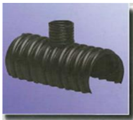
Injizierhalbschalen mit Entlüftungsabgang Ø 13/23 mm injection semi-couplers with venting stud Ø 13/23 mm