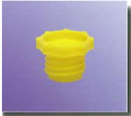
Schraubverschlusskappen Ø 13/23 mm screw sealing caps Ø 13/23 mm