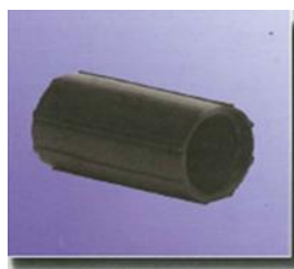
Schlauchmuffen Ø 13/23 mm tube couplers Ø 13/23 mm