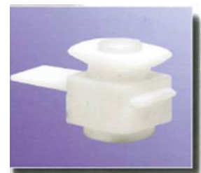
Absperrschieber Ø 13/23 mm stop valves Ø 13/23 mm