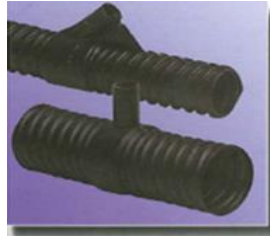
Injiziermuffen in verschiedenen Größen injection couplers in various dimensions