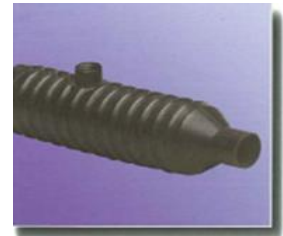
Spezialmuffen in verschiedenen Größen special couplers in in various dimensions