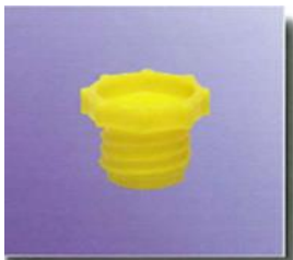
Schraubverschlusskappen Ø 13/23 mm screw sealing caps Ø 13/23 mm