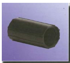
Schlauchmuffen Ø 13/23 mm tube couplers Ø 13/23 mm