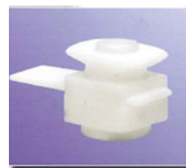
Absperrschieber Ø 13/23 mm stop valves Ø 13/23 mm