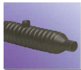
Spezialmuffen in verschiedenen Größen special couplers in in various dimensions