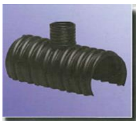
Injizierhalbschalen mit Entlüftungsabgang Ø 13/23 mm injection semi-couplers with venting stud Ø 13/23 mm