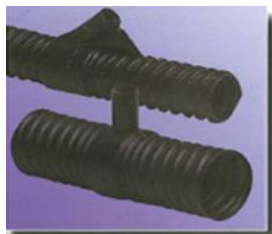
Injiziermuffen in verschiedenen Größen injection couplers in various dimensions